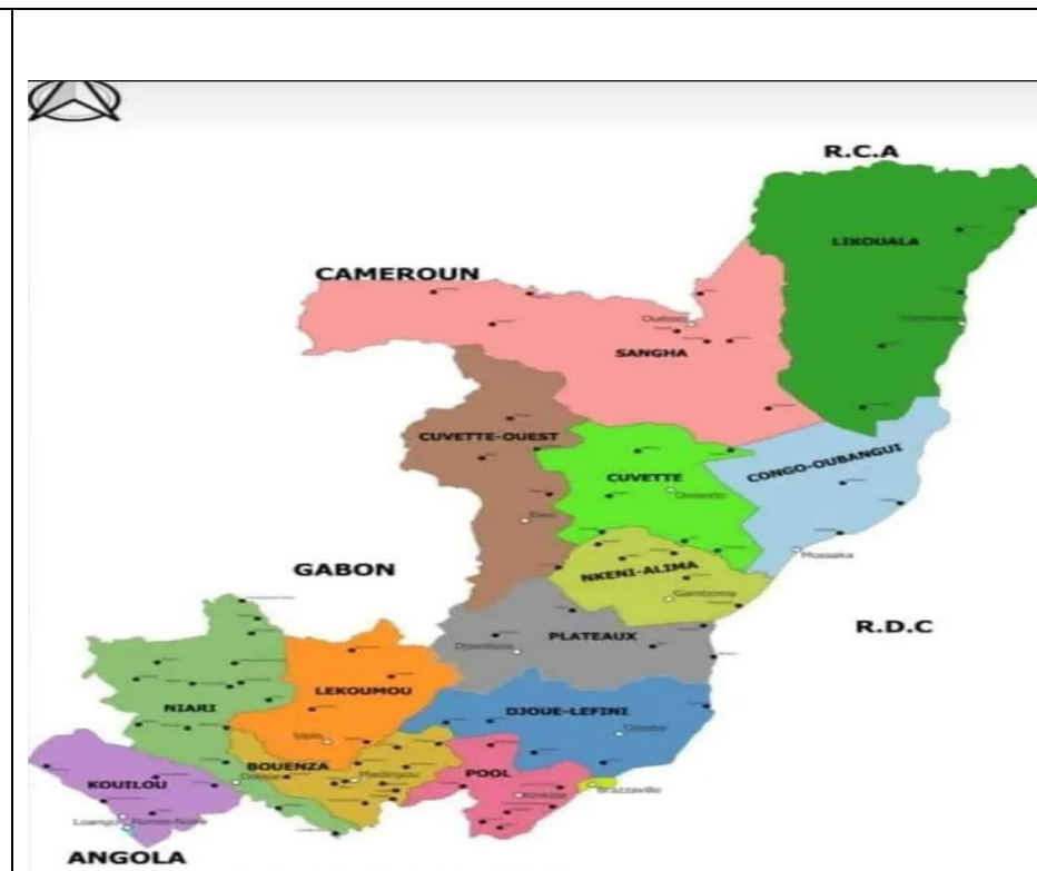
Рис. 2. Карта 2 департаментов Республики Конго (после 3 триместра 2024)