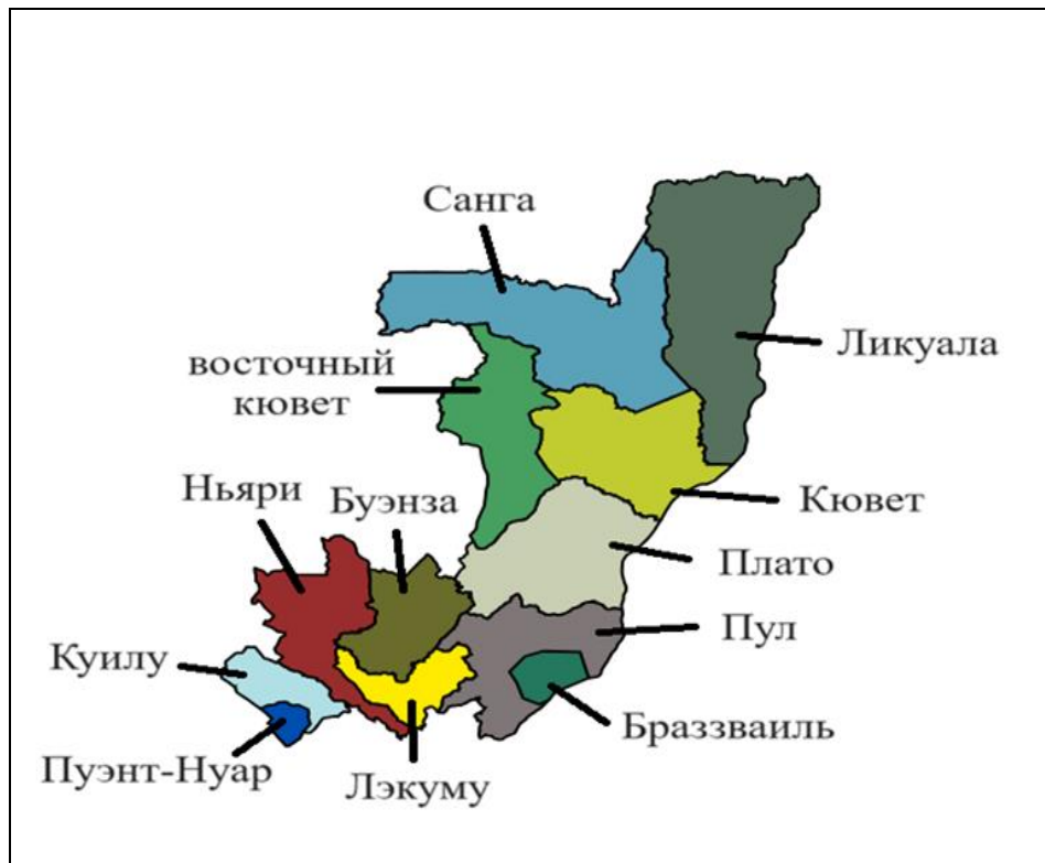
Рис. 1. Карта 1 департаментов Республики Конго (до конца 3 триместра 2024)