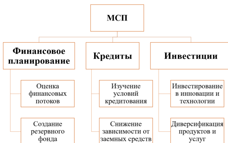
Рис. 5. Рекомендации для малого и среднего предпринимательства 2