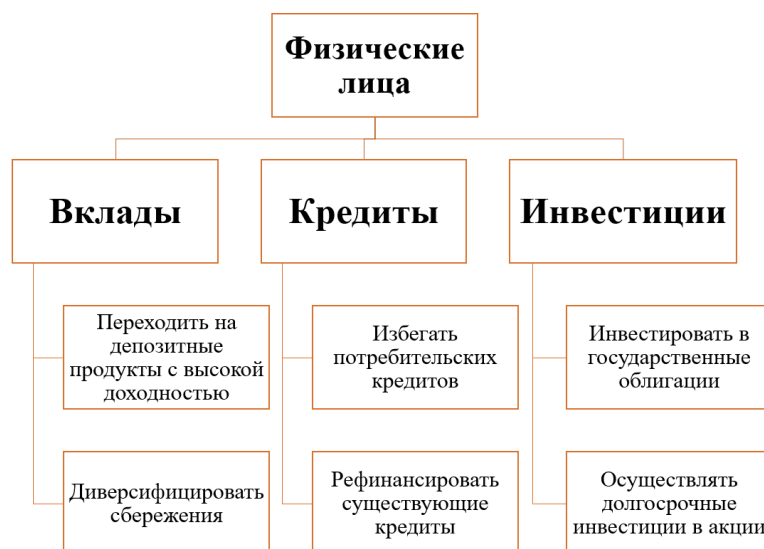
Рис. 4. Рекомендации для физических лиц 1