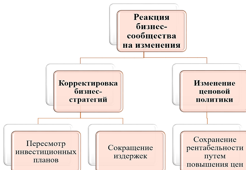
Рис. 3. Анализ реакции бизнеса на изменения 1