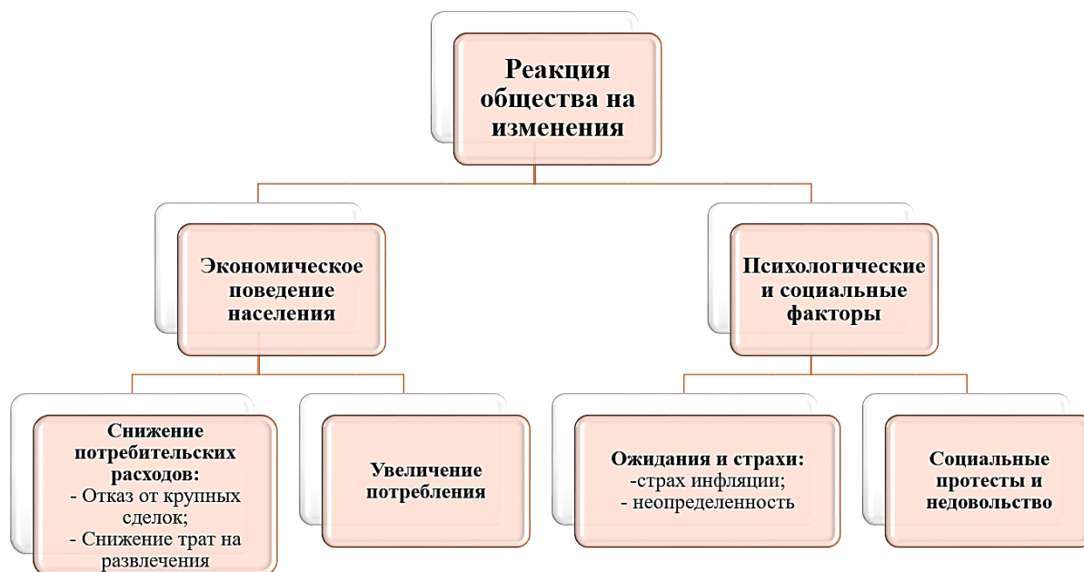
Рис. 2. Анализ реакции общественности на проводимые изменения 1

Исследуя проблему повышения ключевой ставки нельзя не отметить, что, в ходе обсуждения данной темы с друзьями, родными и коллегами можно услышать различные мнения, которые могут варьироваться от положительных, где собеседник согласен с проводимыми изменениями, до негативных, где ясно выражено недовольство и протест. Следует отметить, что некоторые мнения меняются со временем в ту или иную сторону, а некоторые перерастают в большую агрессию и недоверие к финансовым институтам (рис. 2).