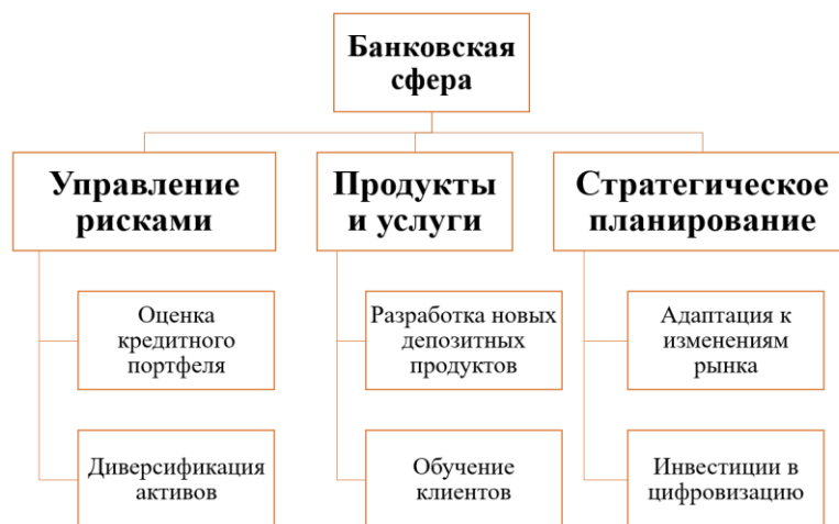
Рис. 6. Рекомендации для банковской сферы 1