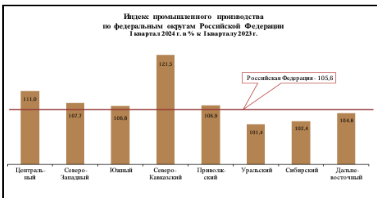
Рис. 3. Индекс промышленного производства по федеральным округам в Российской Федерации 2

При анализе индекса промышленного производства по видам экономической деятельности даже небольшого временного интервала (1 кв. 2023 – 1 кв. 2024 гг.) четко выделяется разница между регионами. По всем округам наблюдается рост, но отличия между ними весьма существенны. В Уральском (1,4%), Сибирском (2,4%) и Дальневосточном (4,8%) федеральных округах этот рост ниже среднероссийского (5,6%). Среди лидеров выделяются Северо-Кавказский (21,5%) и Центральный (11%) федеральные округа (рис. 3). Это объясняется не только спецификой географического положения, имеющейся специализацией, но и, очевидно, воздействием факторов экономической фрагментации, приведшим регионы к необходимости поиска новых точек роста.