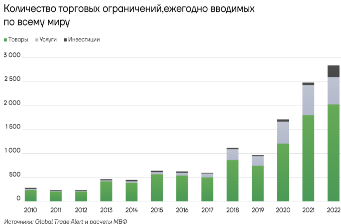
Рис. 4. Динамика количества торговых ограничений, 2010-2022 гг. 1

Как следует из данных рис. 4, количество ограничений, вводимых за последнее время, иллюстрирует их значительное усиление с точки зрения воздействия на макросистемы.