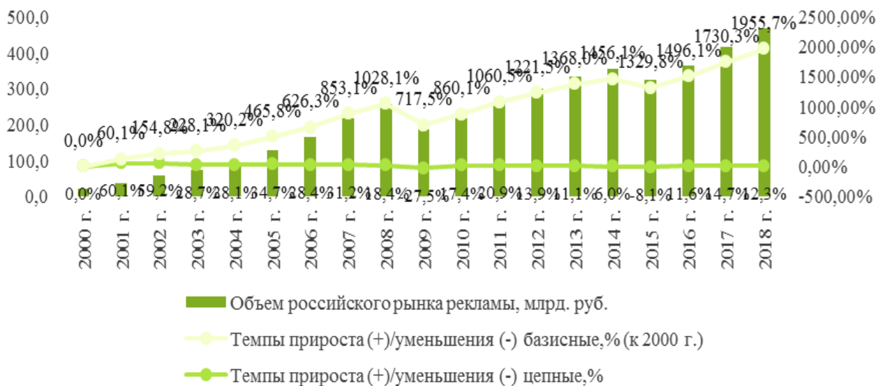
Рис. 1. Показатели динамики объемов российского рынка рекламы, 2000 – 2018 гг., %

Далее обратимся непосредственно к количественным параметрам, характеризующим состояние, тенденции и структуру российского рынка рекламы в последние годы. Начиная с 2000 г. российский рынок рекламы поступательно растет (рис. 1) 3 .