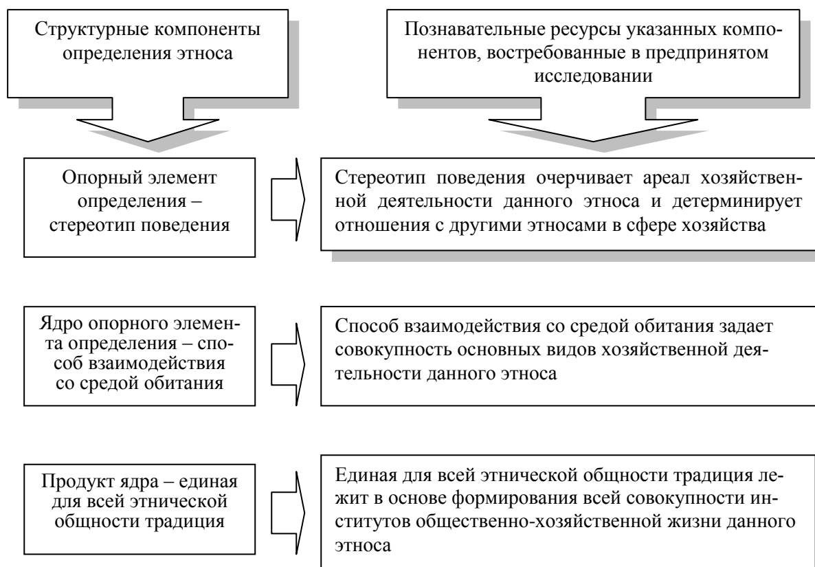
Рис. 2. Структурные компоненты определения этноса, оценка их познавательных ресурсов в контексте исследования (по Л. Гумилеву)

Выше была проведена параллель между этноэкономикой и определенными этническими группами, особенностями укладами общественно-хозяйственной жизни этой этнической группы. Данная связь представляет возможность обозначить важное определение теории этноэкономики, в частности рассматривать данную теорию как особое направление развития экономической науки, которое осуществляет изучение форм экономических отношений, формирующихся в результате предметного воплощения, хозяйственной реализации потенциала созидательной энергии, которым располагает определенный народ.