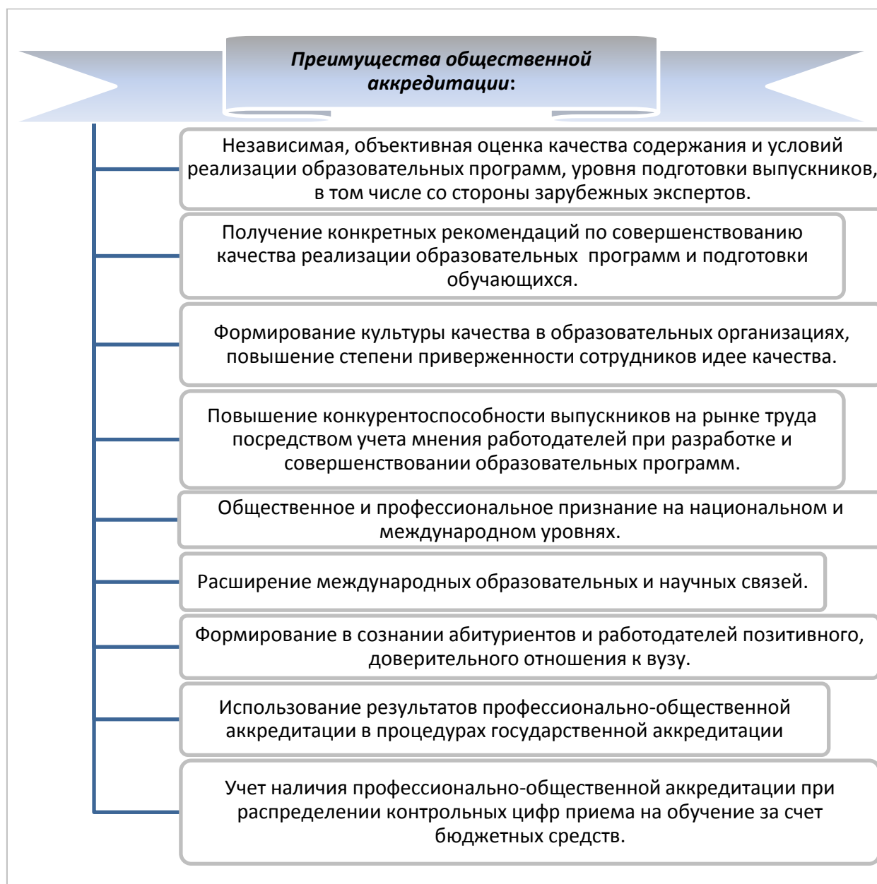
Рис. 3. Преимущества общественной аккредитации

В России одной из организаций, занимающейся общественной аккредитацией, является Национальный центр общественно-профессиональной аккредитации.