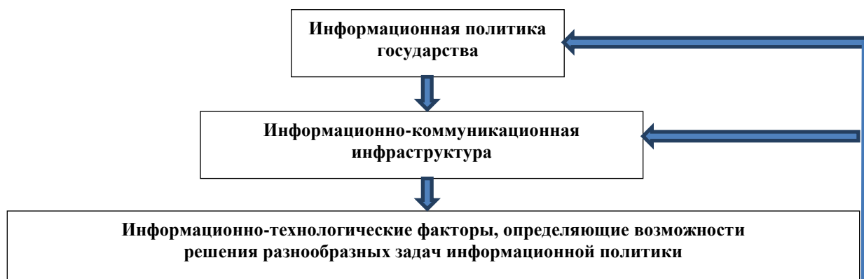
Рис. 1. Схема определения роли и места информационно-технологических факторов в информационной политике государства

На наш взгляд, на рис. 1 определены роль и место в информационной политике государства современных информационно-технологических факторов, как императива совершенствования системы публичного управления.