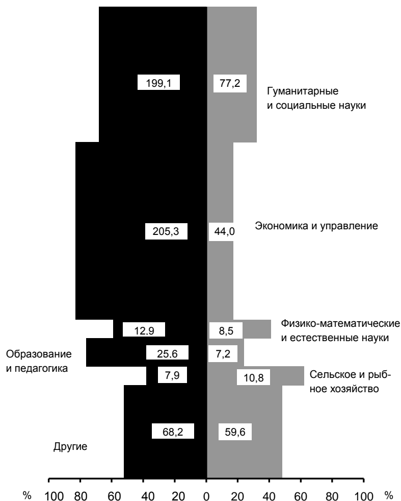
Схема 2. Распределение работников, замещавших государственные должности и должности государственной гражданской службы и имевших высшее профессиональное образование, по направлениям подготовки. По состоянию на 1 октября 2013 г. [1, с. 183]

Интерпретируя материалы экспертного опроса 2013 года, в котором участвовали 251 государственный служащий, в качестве факторов «спасающих» мужчин от дискриминации и дающие преимущества выделили: