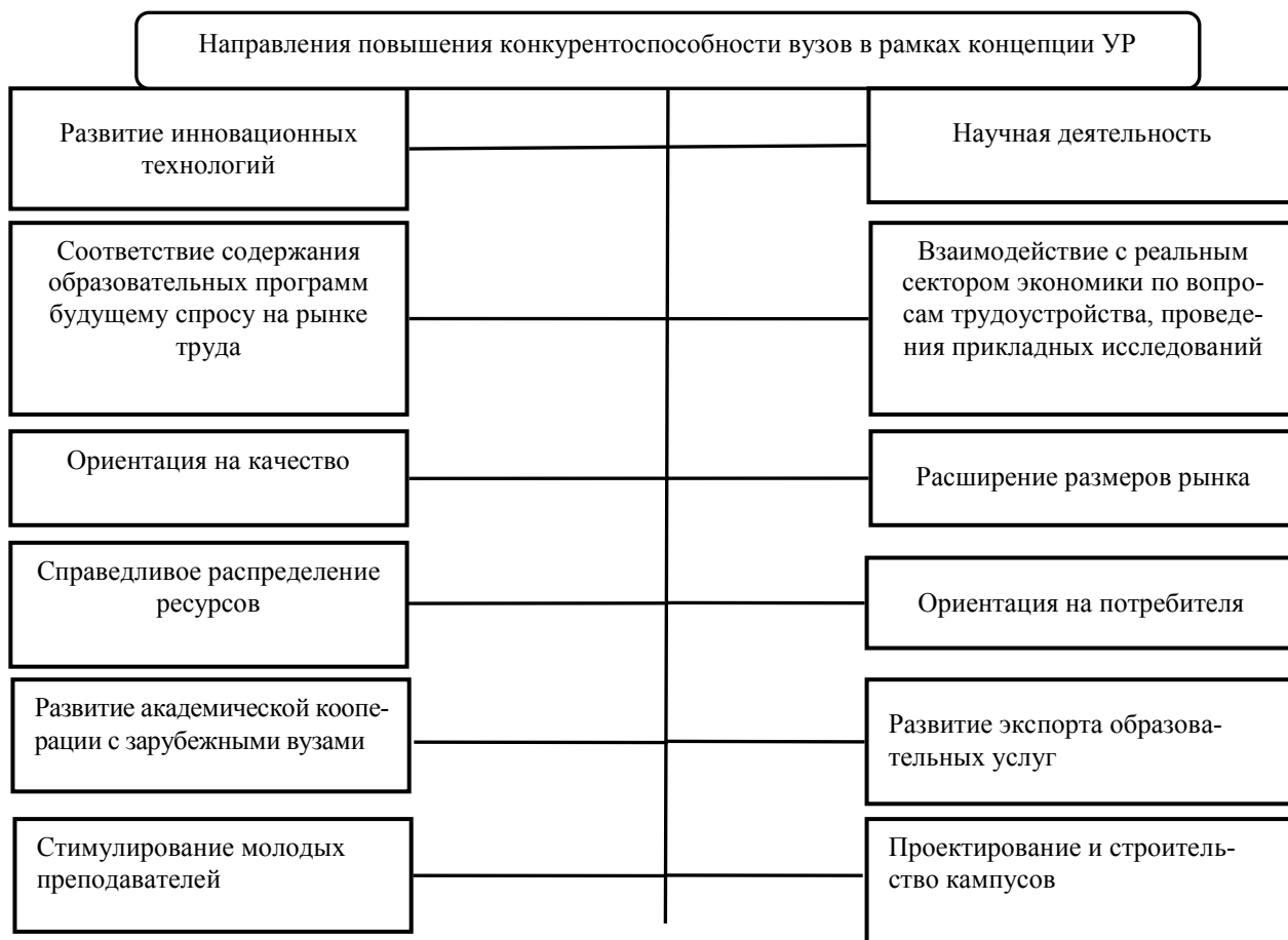
Рис. 2. Направления повышения конкурентоспособности вузов в рамках концепции устойчивого развития